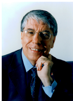
Sen. Carlo Giovanardi

Sottosegretario di Stato per la Famiglia, Droga e Servizio Civile Presidenza del Consiglio dei Ministri